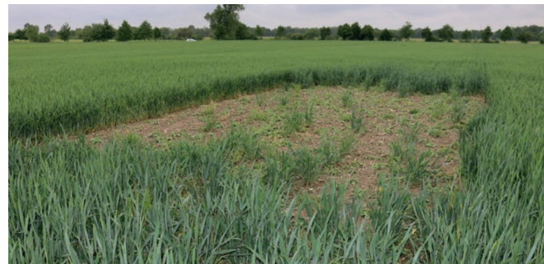
Felderchenfenster in Winterweizen

Die Sämaschine wird während des Sävorganges einfach kurz ausgehoben, um eine Saatlücke zu erhalten. Die Größe liegt bei ca. 20 m 2 , bei 2 Stück pro ha. Nach der Saat können die Fenster zusammen mit dem regulär angesäten Teil des Ackers behandelt werden, d.h. sie können normal mitgespritzt und mitgedüngt werden. Die Mindererträge durch das Ausheben der Sämaschine sind aufgrund der kleinen Fläche äußerst gering (bei 40 m 2 /ha und einem Erlös von rund 1.400,- €/ha z. B. für Winterweizen etwa 5,60 €/ha).