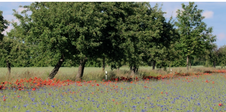
Blühstreifen in der näheren Umgebung der Lerchenfenster sind wichtige Nahrungsquellen.

So können auch andere Arten der offenen Feldflur, wie zum Beispiel Rebhuhn oder Feldhase, von den Lerchenfenstern und zusätzlichen Blühstrukturen profitieren.