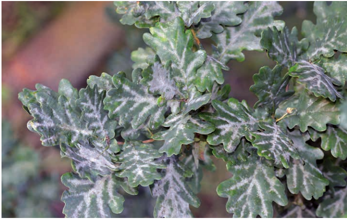
Abb. 1: Echter Mehltau Eiche

Das Mittel wird als nicht schädigend für Populationen relevanter Nutzinsekten eingestuft und als nicht schädigend für Populationen relevanter Raubmilben und Spinnen eingestuft.