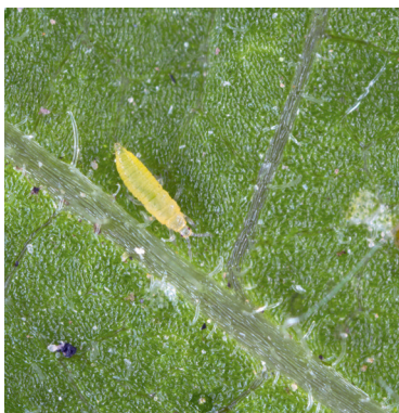
Thrips, Frankliniella occidentalis

Basis der Nemasys -Produktfamilie sind freilebende entomopathogene Nematoden, die aktiv in Schadinsekten eindringen und dort symbiotische Bakterien abgeben. Die Bakterien töten das Schadinsekt innerhalb von 48 Stunden und dienen neben dem verdauten Insektenkadaver als Nahrung für die sich entwickelnden Nematoden. Im Zierpflanzen-, Kräuter- und Gemüsebau, sowie Baumschulen finden häufig die Nematoden Steinernema feltiae und Steinernema carpocapsae Anwendung, die eine effektive biologische Kontrolle einer großen Anzahl an Schadinsekten, wie Thripse und Sumpfliegen ermöglichen.