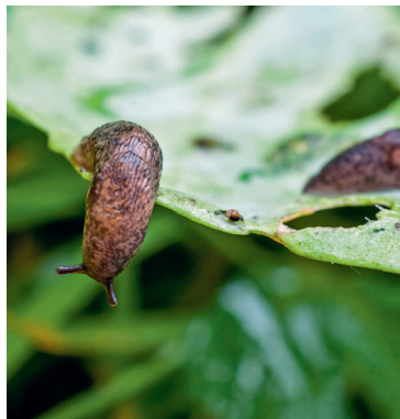
Ackerschnecke, Deroceras spp.

Nacktschnecken verursachen große Schäden bei einer Vielzahl an Gemüse und Zierpflanzen auf Feldern, in Gärten, Baumschulen und öffentlichen Grünflächen. Nemaslug® enthält räuberische Phasmarhabditis hermaphrodita Nematoden, die im Boden Nacktschnecken aufsuchen, in diese eindringen und infizieren. Infizierte Nacktschnecken stellen darauf die Fressaktivität ein und sterben innerhalb weniger Tage ab. Nemaslug® bietet Kontrolle über ein breites Spektrum unterschiedlicher Nacktschnecken wie bspw. Deroceras spp. (Ackerschnecke) und Arion spp. (Wegschnecke).