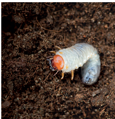
Engerling, bspw. Phyllopertha horticola

Basis der Nemasys -Produktfamilie sind freilebende entomopathogene Nematoden, die aktiv in Schadinsekten eindringen und dort symbiotische Bakterien abgeben. Die Bakterien töten das Schadinsekt innerhalb von 48 Stunden und dienen neben dem verdauten Insektenkadaver als Nahrung für die sich entwickelnden Nematoden. Im Zierpflanzen-, Kräuter und Gemüsebau, sowie Baumschulen finden häufig die Nematoden Heterorhabditis bacteriophora und Steinernema kraussei Anwendung, die eine effektive biologische Kontrolle einer großen Anzahl an Schadinsekten, wie Engerlingen und Dickmaulrüsslern ermöglichen.