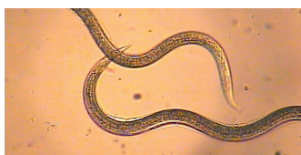
Nematoden 400-fach vergrößert

nimmt erst dann ab, wenn der Schädling nicht mehr vorhanden ist, der Boden zu trocken wird oder wenn die Boden- oder Umgebungstemperatur zu niedrig wird.